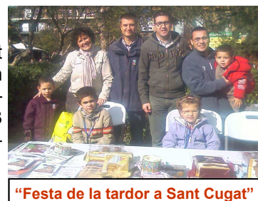
“Festa de la tardor a Sant Cugat”