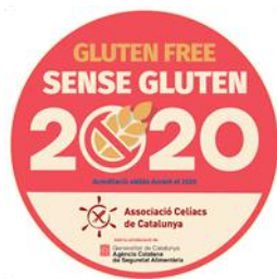
Icona identificativa per l'establiment

L'adhesiu és vàlid per a l'any en curs , per la qual cosa anualment es faran revisions del procediment que avalin la continuïtat del protocol.