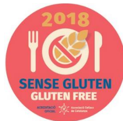
Icona identificativa per l'establiment

L'adhesiu és vàlid per a l'any en curs , per la qual cosa anualment es faran revisions del procediment que avalin la continuïtat del protocol.