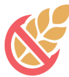
Icona identificativa de Producte Sense Gluten per al Llistat de productes

El distintiu pel producte " Sense Gluten " s'enviarà un cop superada l'acreditació, i a petició del Minorista.