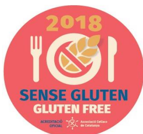
Icona identificativa per l'establiment

L'adhesiu és vàlid per a l'any en curs , per la qual cosa anualment es faran revisions del procediment que avalin la continuïtat del protocol.